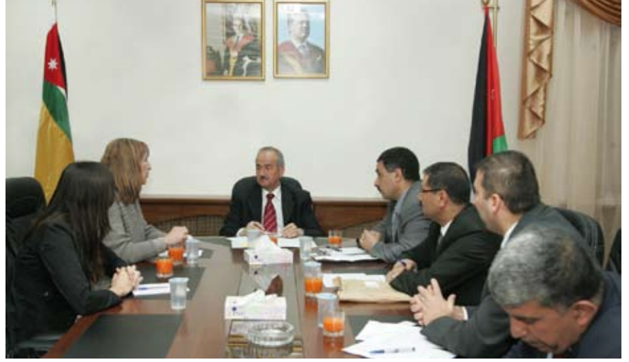
من مباحثات الجامعة مع مجموعة التداول للتصنيع وإدارة المشاريع في العقبة

وأشارت إلى استعداد المجموعة لتقديم خبراتها لطلبة الجامعة في العقبة في الميادين العلمية والبحثية.