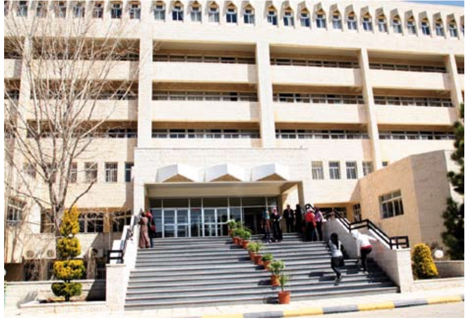
البوابة الرئيسية لكلية العلوم التربوية