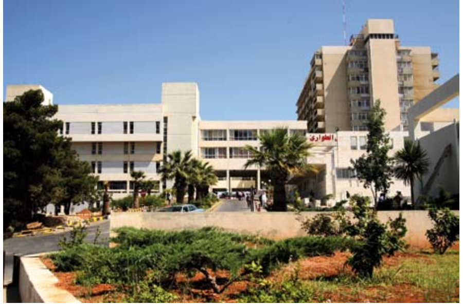
زهة ٢٣ ألف مريض راجع عيادات أمراض القلب عام ٢٠٠٩